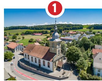
1 ÉGLISE ST-JEAN-BAPTISTE CONSÉCRATION 1835 BOURDON DE 5 TONNES