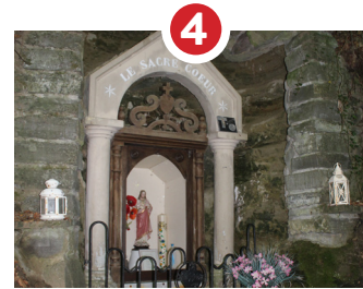
4 ORATOIRE DU SACRÉ-COEUR 1910