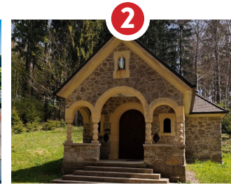
2 CHAPELLE NOTRE-DAME DE LA BRILLAZ, SAINTE PATRONNE DE L'UNITÉ PASTORALE, 1927