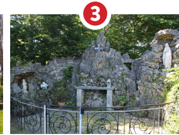
3 GROTTE, ORATOIRE NOTRE-DAME DE CHEZ NOUS 1951