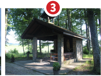
3 ORATOIRE NOTRE-DAME DE FATIMA 1959