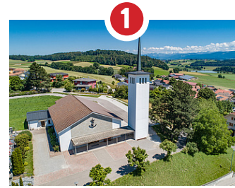
1 ÉGLISE ST-JACQUES CONSÉCRATION 1958