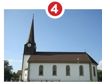
4 ÉGLISE ST-AURICE FIN 19 ÈME SIÈCLE