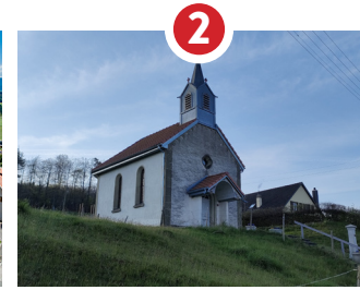
2 CHAPELLE ST-GORGON 1599