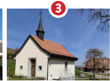
NOTRE-DAME DE NIERLET 1690