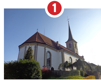
ÉGLISE IMMACULÉE CONCEPTION 1847-1854