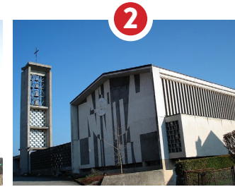
ÉGLISE ST-MARTIN CONSÉCRATION 1958, OEVRES D'ARTISTES FRIBOURGEOIS