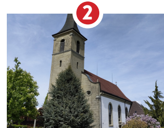
ÉGLISE IMMACULÉE CONCEPTION 1847-1854