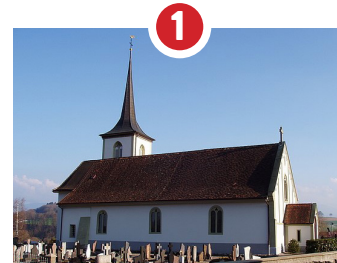
ÉGLISE ST-JULIEN 1146 RECONSTRUCTION 1747