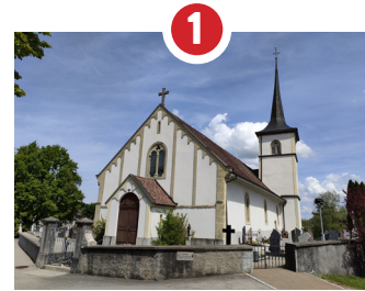
ÉGLISE ST-JULIEN 1146 RECONSTRUCTION 1747