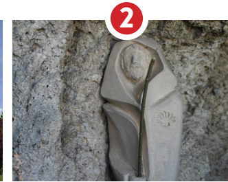
ORATOIRE ST-JACQUES 2000