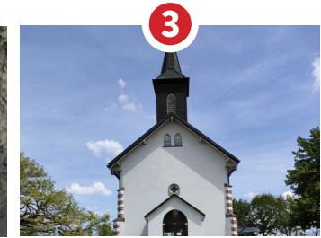
CHAPELLE SAINTE-TRINITÉ STYLE NÉO-ROMAN 1897