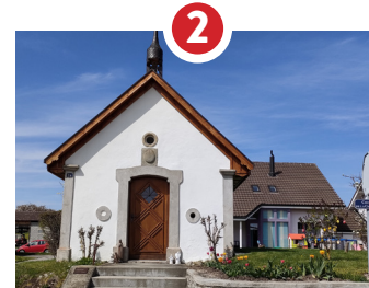
2 CHAPELLE SAINT-GARIN PROTECTEUR DU BÉTAIL 1749