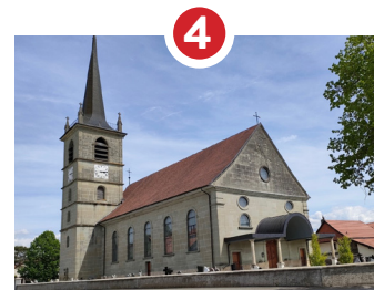
4 ÉGLISE ST-MAURICE NÉO-CLASSIQUE 1832