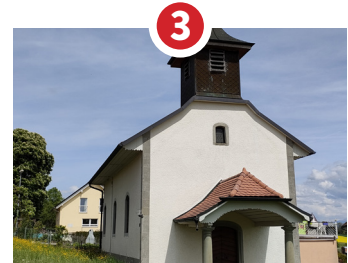
3 CHAPELLE NATIVITÉ-DE-MARIE 1749