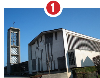
1 ÉGLISE ST-MARTIN CONSÉCRATION 1958, OEVRES D'ARTISTES FRIBOURGEOIS