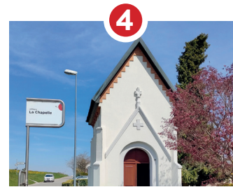
CHAPELLE DE PELLEVOISIN 1894