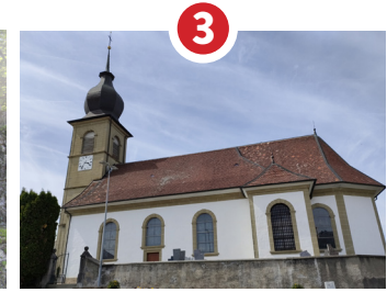
EGLISE STS-PIERRE-ET-PAUL BAROQUE, CLOCHER EN BULBE 1840