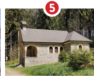
CHAPELLE NOTRE-DAME DE LA BRILLAZ, SAINTE PATRONNE DE L'UNITÉ PASTORALE, 1927