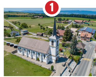
ÉGLISE STS-PIERRE-ET-PAUL CONSTRUCTION 1896 CONSÉCRATION 1912