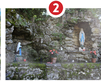
GROTTE, ORATOIRE NOTRE-DAME DE LOURDES 1958